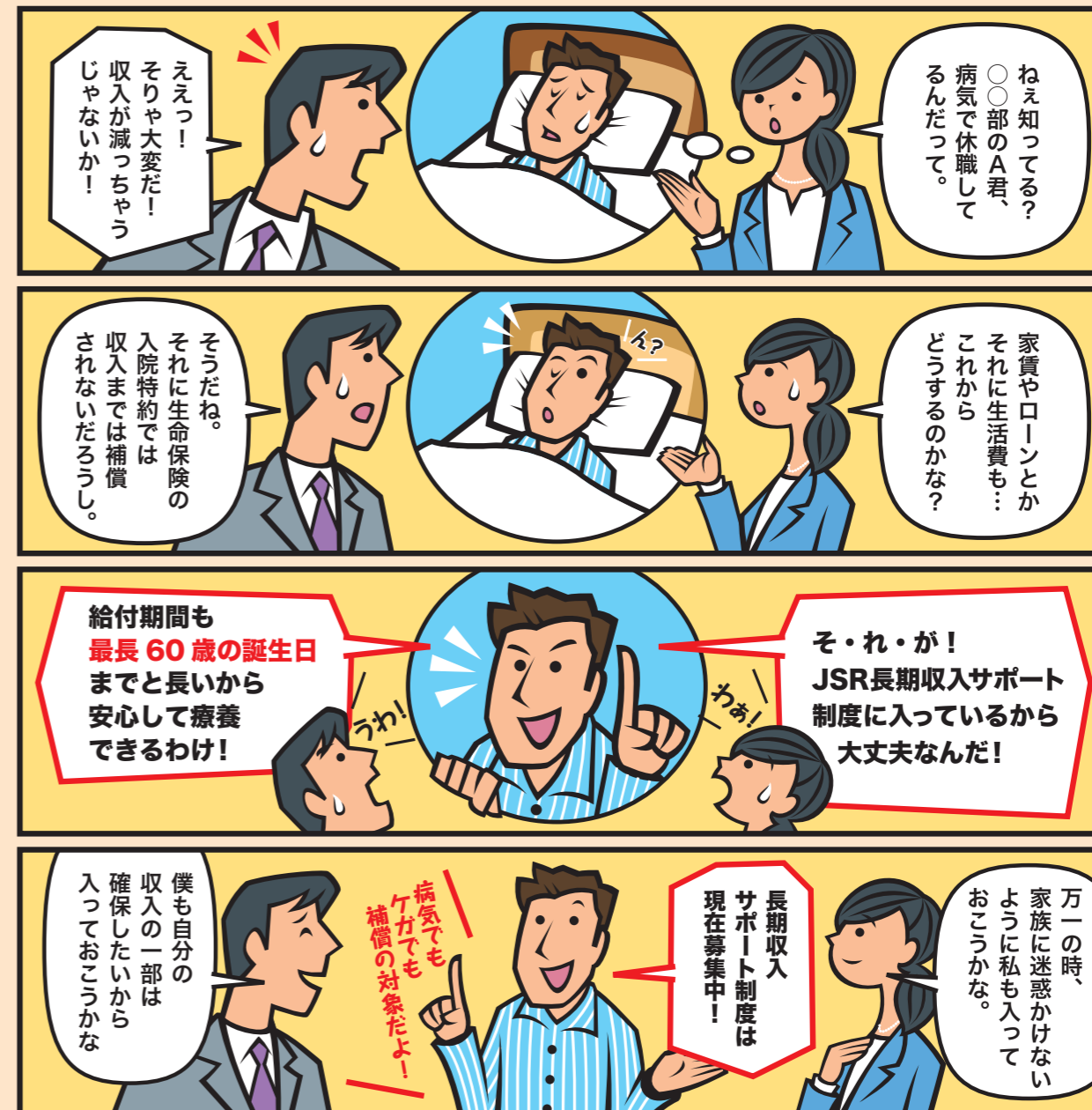
この制度の詳細内容は、中面をご確認ください。

JSRでは、社員の皆さんが病気やけがにより万が一働けなくなった場合に備え、「長期収入サポート制度」を導入しています。 補償を万全なものとしていただくために、上乗せ補償である任意加入契約をご案内いたします。